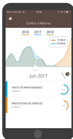
Aperçu en version mobile